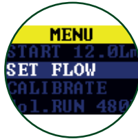
Intuitivo menú de navegación