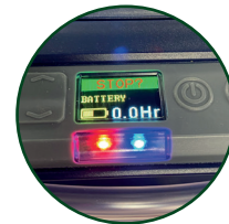
Pantalla en color OLED con luces LED de color rojo/azul visibles a distancia que indican el estado de la bomba

Utilice la aplicación Airwave de Casella en cualquier dispositivo móvil para controlar y monitorizar de forma remota varias bombas a la vez.