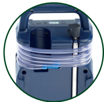
La bomba lleva instalados el mástil y el tubo de muestreo durante el uso y el transporte

El Vortex3 es un dispositivo perfecto para el personal que realiza inspecciones de muestreo formado a nivel RP402 por BOHS.