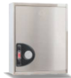
Mod. 690 CI Mod. 690 CIT45